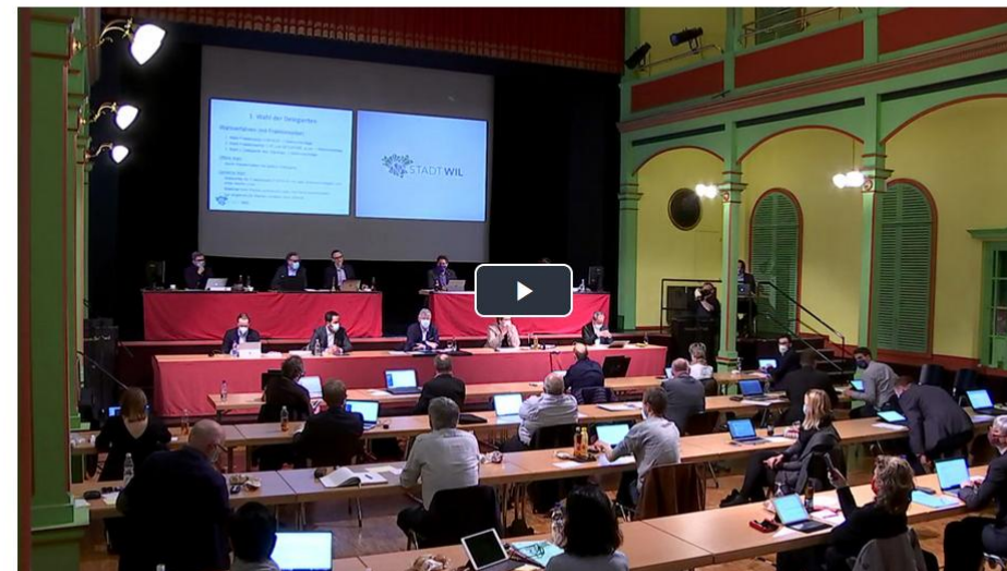
Sitzung Wiler Stadtparlament Aufzeichnung vom 04.03.2021